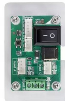
Placă de circuit