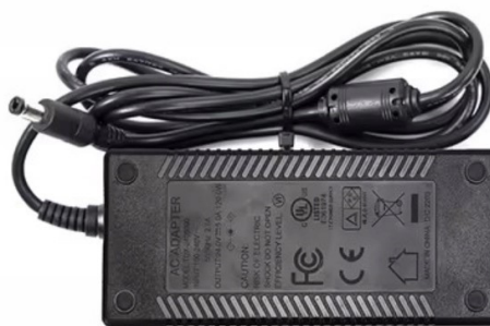
Adaptor de alimentare