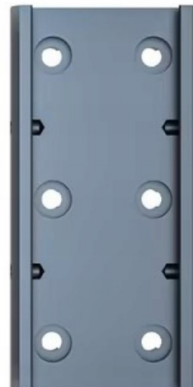
Șină de ghidare