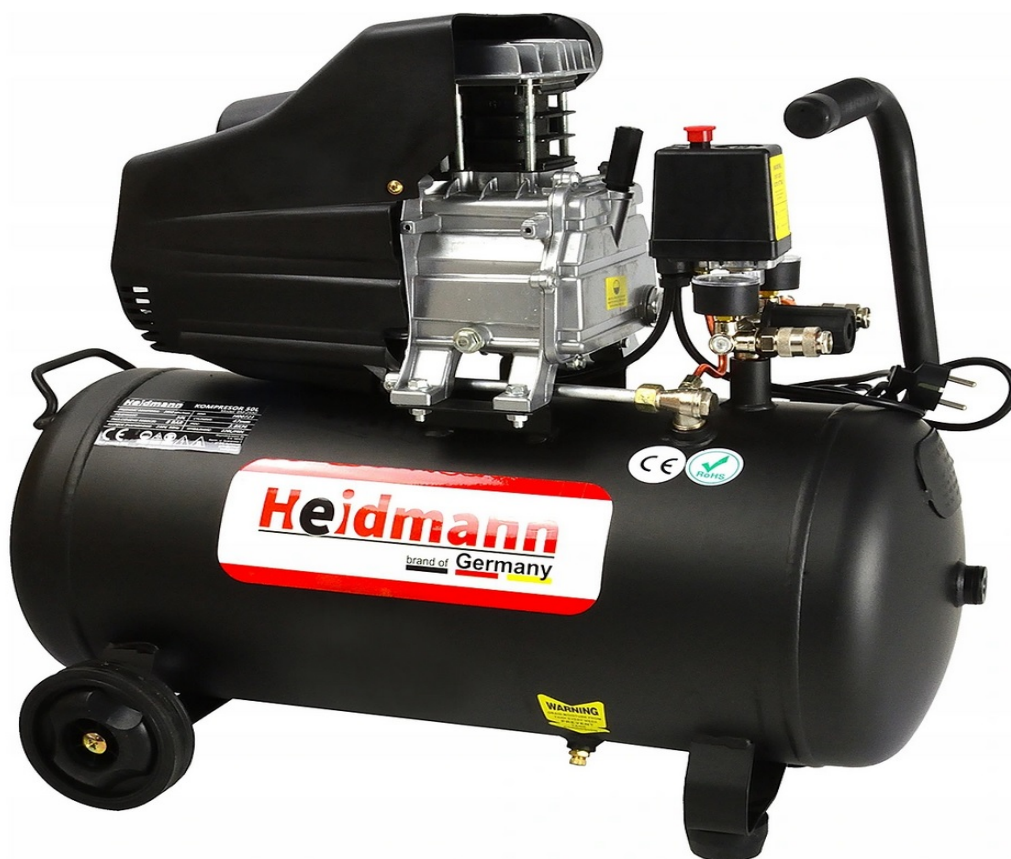
COMPRESOR ULEI 50L 8bar HEIDMANN H00721

CEL MAI NOU compresor are putere mare și circulație a aerului mărită până la 220l/min motiv pentru care este folosit în atelierele personale și în cele profesionale de mașini pentru mentenanța dispozitivelor pneumatice.